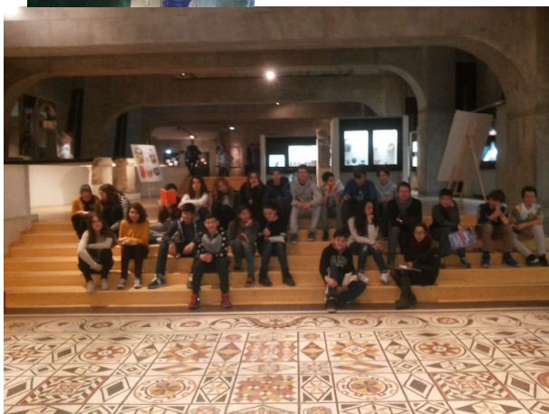
Museo Gallo-romano di Lugdunum, nome latino di Lione, dove nacquero gli imperatori Claudio e Caracalla.