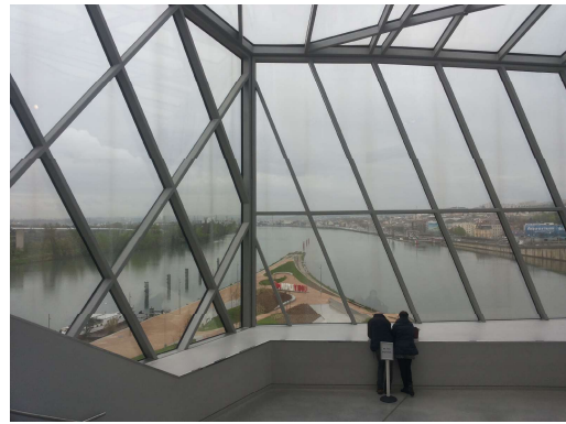
Martedì 5, Musée des Confluences, museo etnografico e di storia naturale.