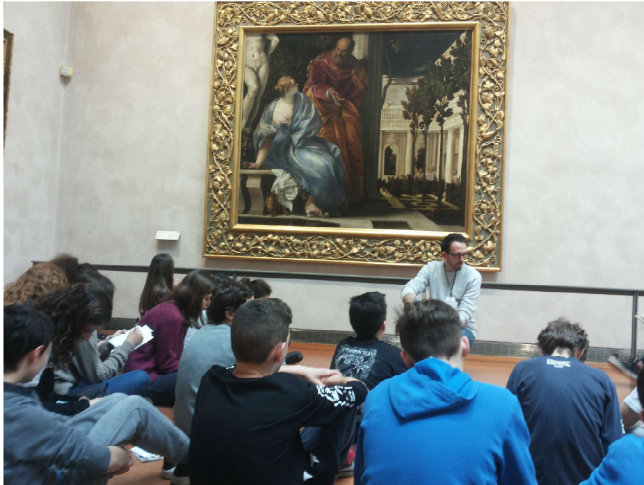
Giovedì 7, visita guidata al Musée des Beaux-Arts