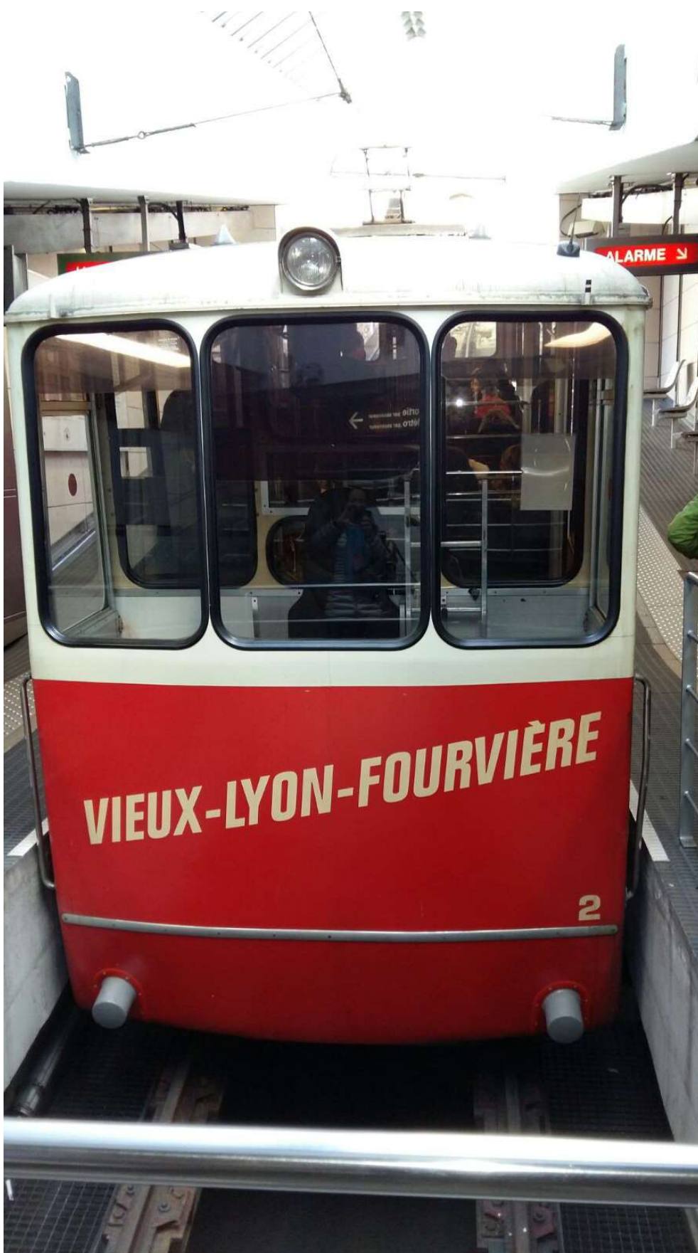
Venerdì 8 aprile, in funicolare per la collina Fourvière.