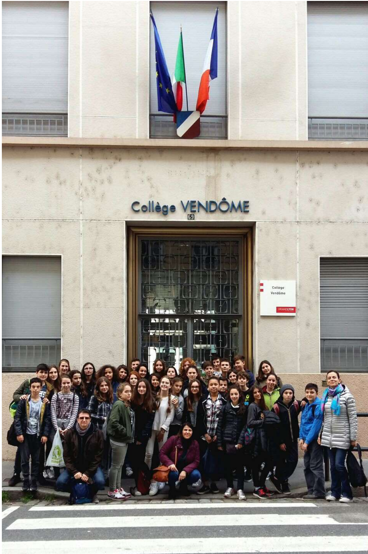
Uscita pomeridiana alla scoperta della città!