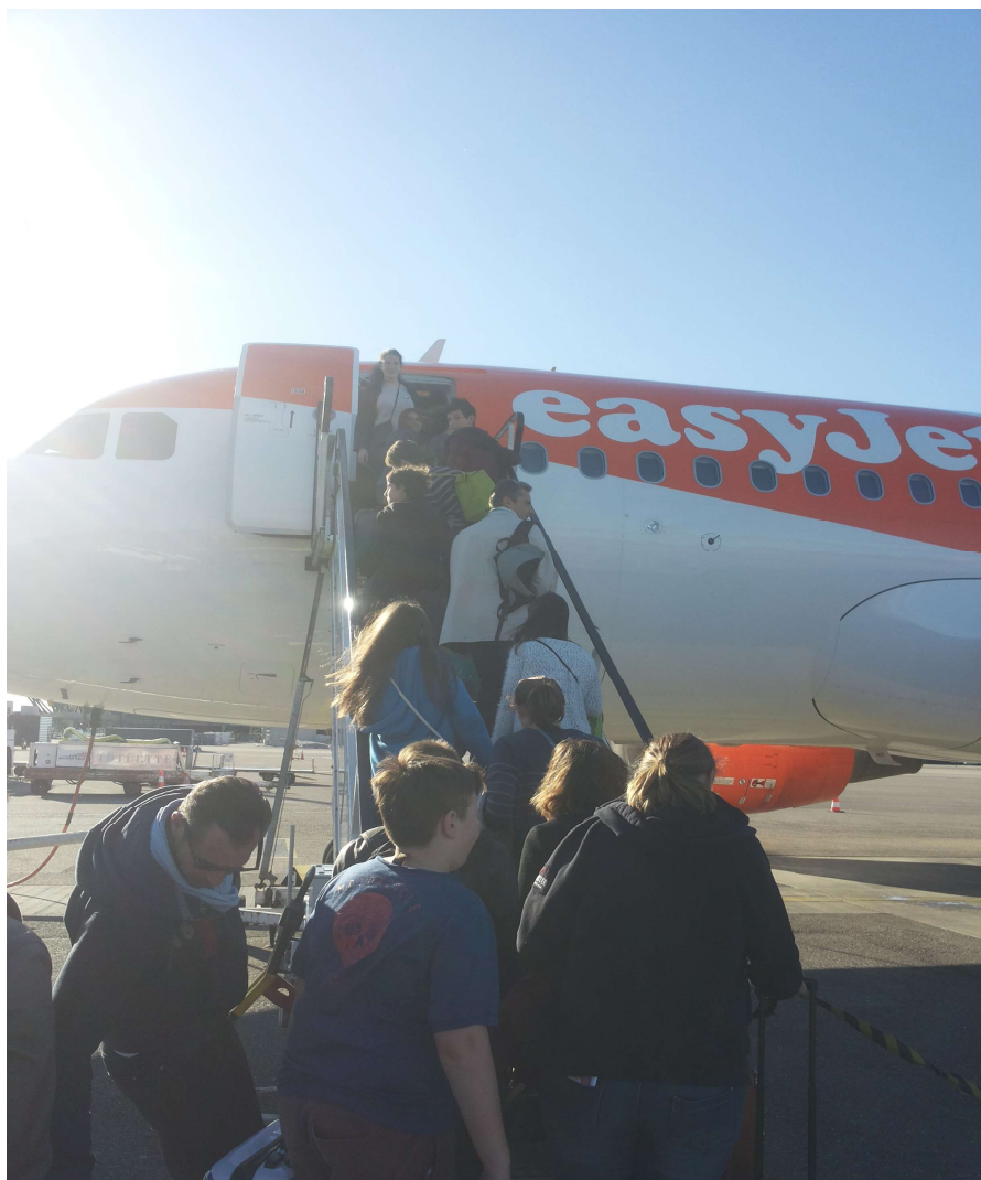
Domenica 3 aprile, in partenza per Lyon!