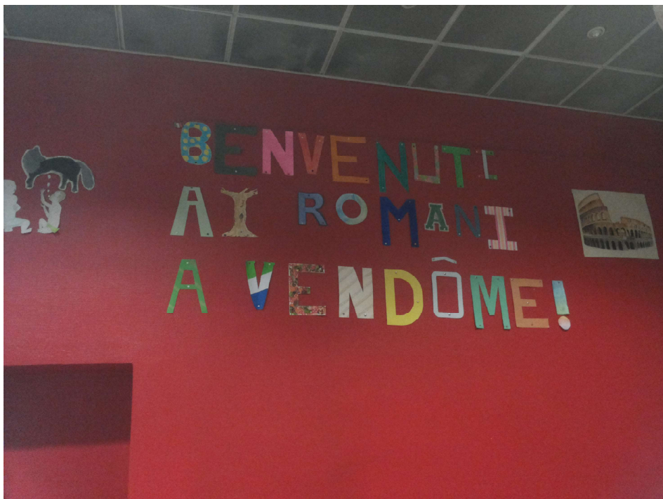
Lunedì 4 aprile ore 8, gli alunni arrivano al collège Vendome dove li attende il benvenuto.