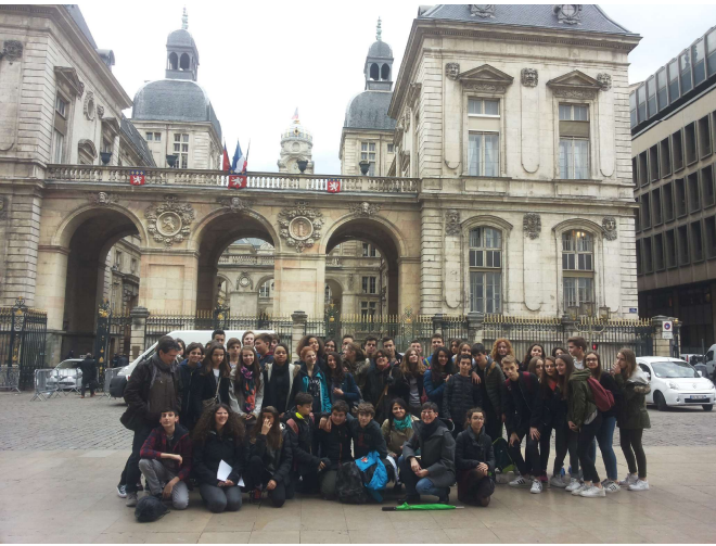
L'Hotel de ville