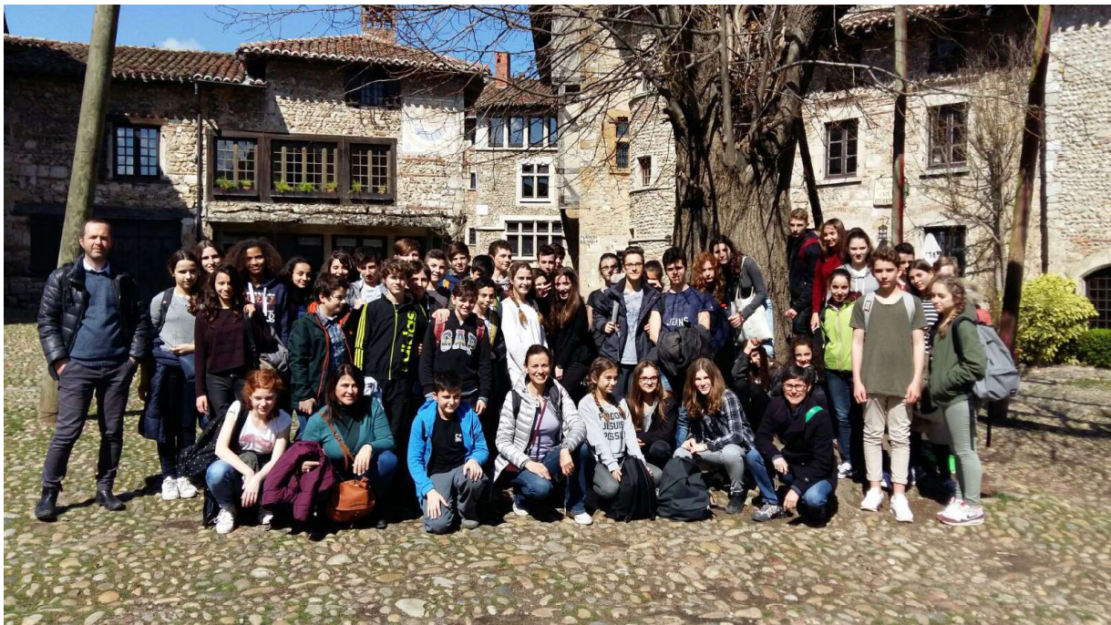
Mercoledì 6 aprile, gita in pullman per visitare l'antica cittadina di Pérouges!