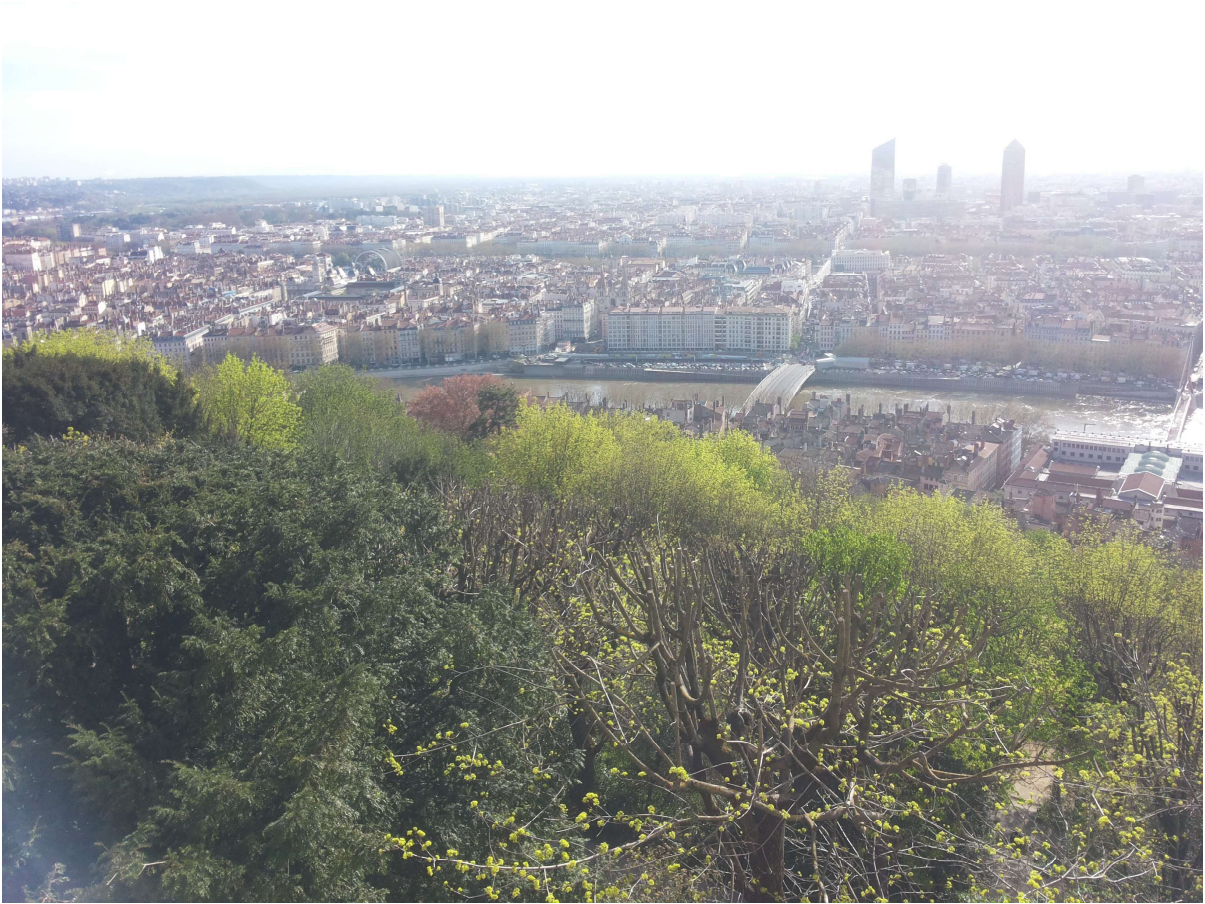
Vista della città dalla collina.